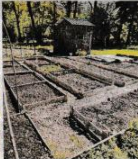
Les jardins donneront leurs premiers légumes au printemps 2023.