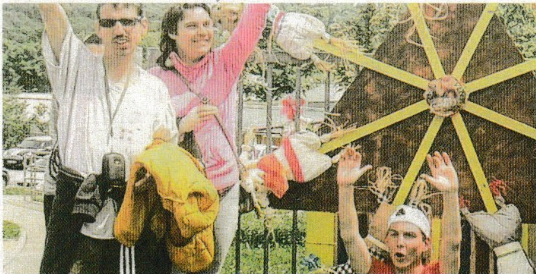
Les adultes et enfants en situation de handicap s'épanouissent au sein des « Papillons Blancs ».

Des professionnels permettent de développer les compétences professionnelles et psychosociales de ces personnes en situation de handicap.